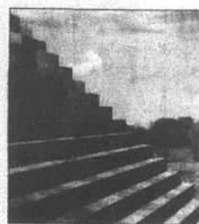
金字塔每塊石磚都是一個內藏骨灰的龕位，圖為金字塔磚梯梯構圖。

金字塔每塊石磚體積為1立方米，建成後金字塔體積超過4000萬立方米，即超過有4000萬個龕位，按此數字計算，金字塔可帶來逾2000億港元收益。報道形容，這金字塔將成為全球最大紀念碑及「全人類的墓地」，全球已有數百人預訂塔內的石磚龕位。