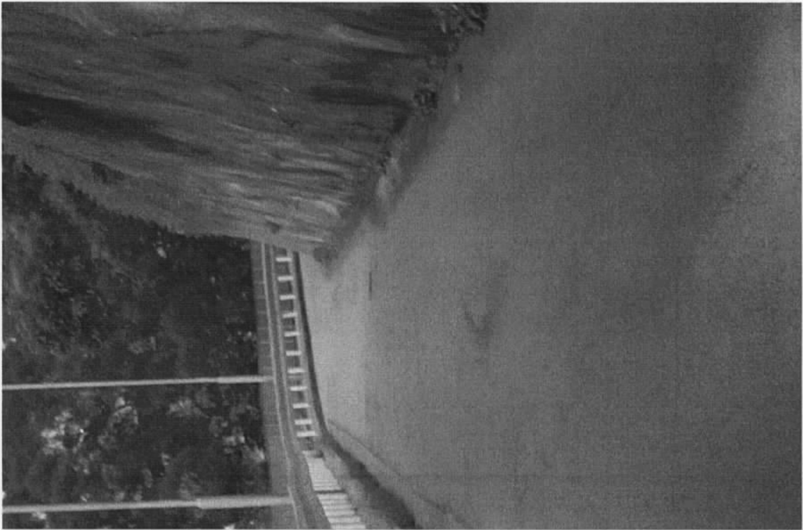
哥連臣角道(往哥連臣懲教署)