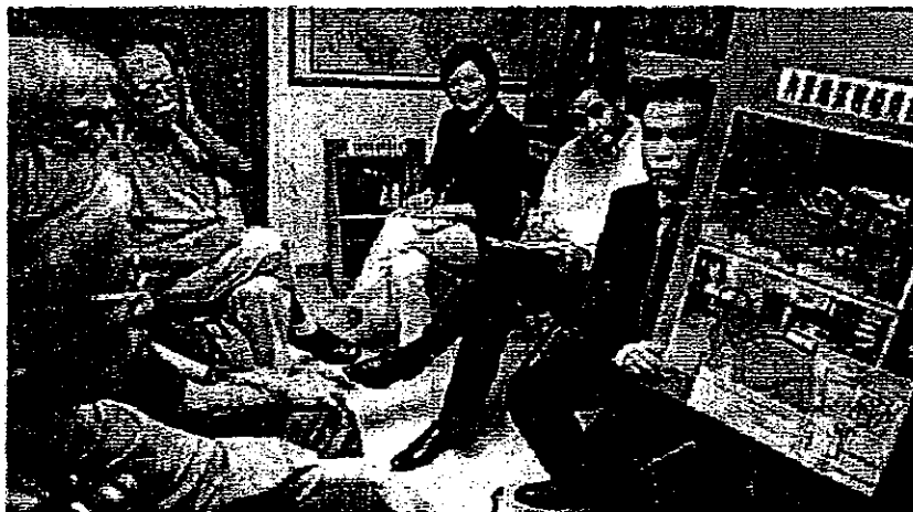
李慧琼及陳仲翔舉辦紅磡居民交流會，梁振英出席聽取街坊訴求。

居民心聲 「區區有本難唸的經」。紅磡區近年發展大量私人屋苑，但區內舊樓維修、劏房及殯儀業衍生的社區問題尚未解決。民建聯立法會議員李慧琼昨日聯同地區幹事陳仲翔舉行紅磡居民交流會，並邀請了行政會議召集人梁振英 (CY) 到場聽取街坊的訴求。CY認同紅磡舊區有重建發展潛力，並承諾會向市建局反映意見。 在居民大會上，有街坊投訴區內劏房問題嚴重，「1戶變4戶」不單加重電力負擔，易生火警，更招徠大量尼泊尔人、新來港人士及內地學生遷駐，並形容大廈猶如「聯合國」。