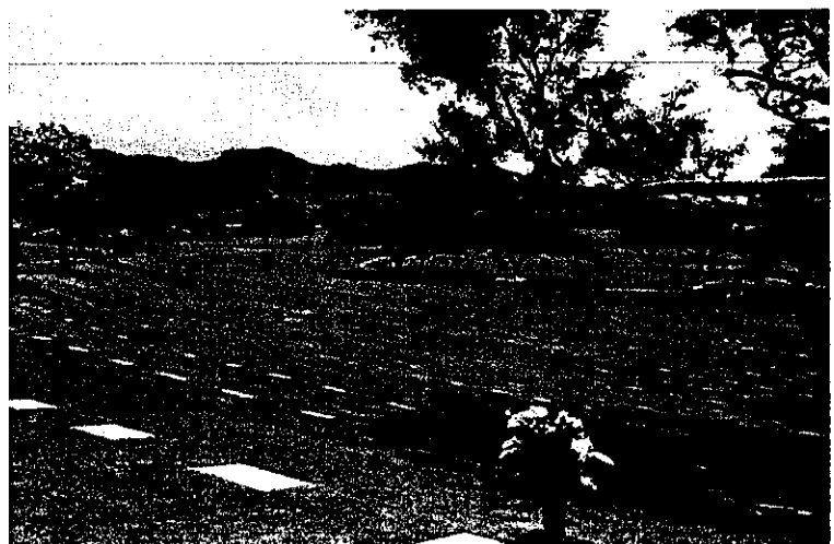
亦可參考外國朝天碑的設計，外觀上使墓園變成公園，在紀念摯親時，亦可親近大自然。