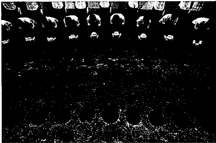
使用可自然分解環保骨灰盅土葬,既環保又不損害自然環境

新界鄉間偏遠地區及離島現時絕大部分為自然山地，動植物資源豐富，骨灰龕園應依天然地勢而建，並且不應興建高大建築物，減少對地形地貌的改變和土石方量，從而將對當地生態環境的影響減至最小；同時亦可降低建造及營運成本，還利於民。