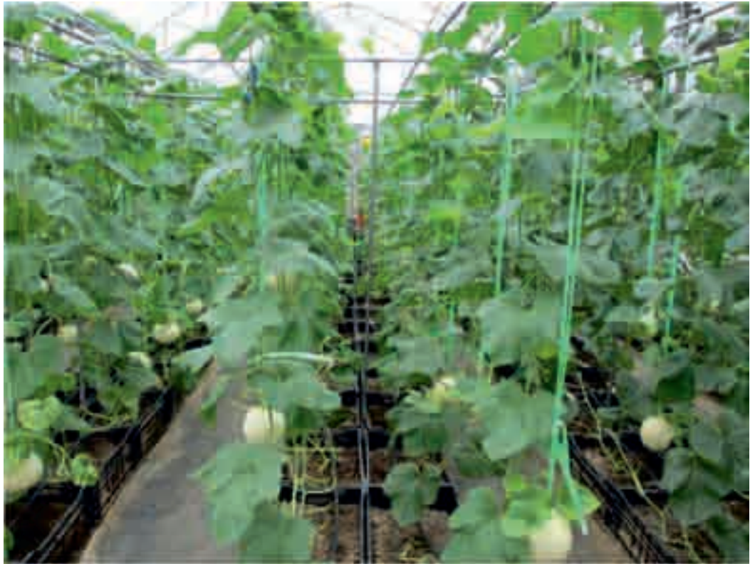
在溫室內栽培高值有機農作物