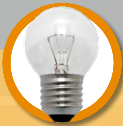
蠟燭形、花式圓形及其他裝飾燈泡