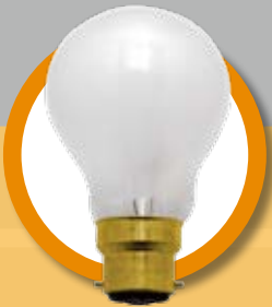
一般照明用的 磨砂燈泡